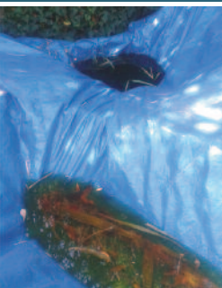
Poches d'eau dans les bâches