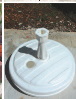
Colonne et socle de parasol

L'élimination des gîtes en eau est la méthode la plus efficace contre cet insecte : elle rend inutile le recours à des traitements insecticides.