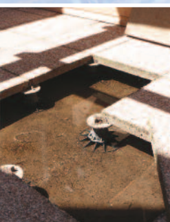
Terrasses sur plots