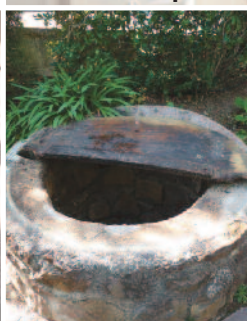
Puits non hermétiques