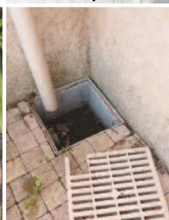
Regards équipés de bac de décantation