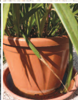
Soucoupes sous les pots