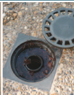
Siphons de sol non entretenus