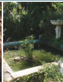
Bassins d'ornement sans poisson