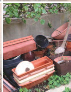
Bacs et réceptacles divers