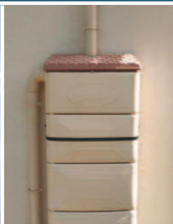
Réserves d'eau non hermétiques