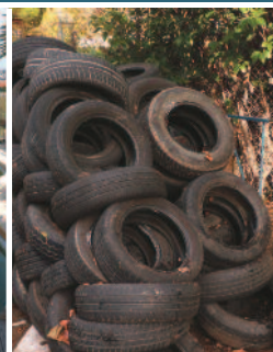
Pneus stockés en extérieur