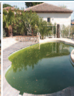
Piscines hors service et bâches de protection