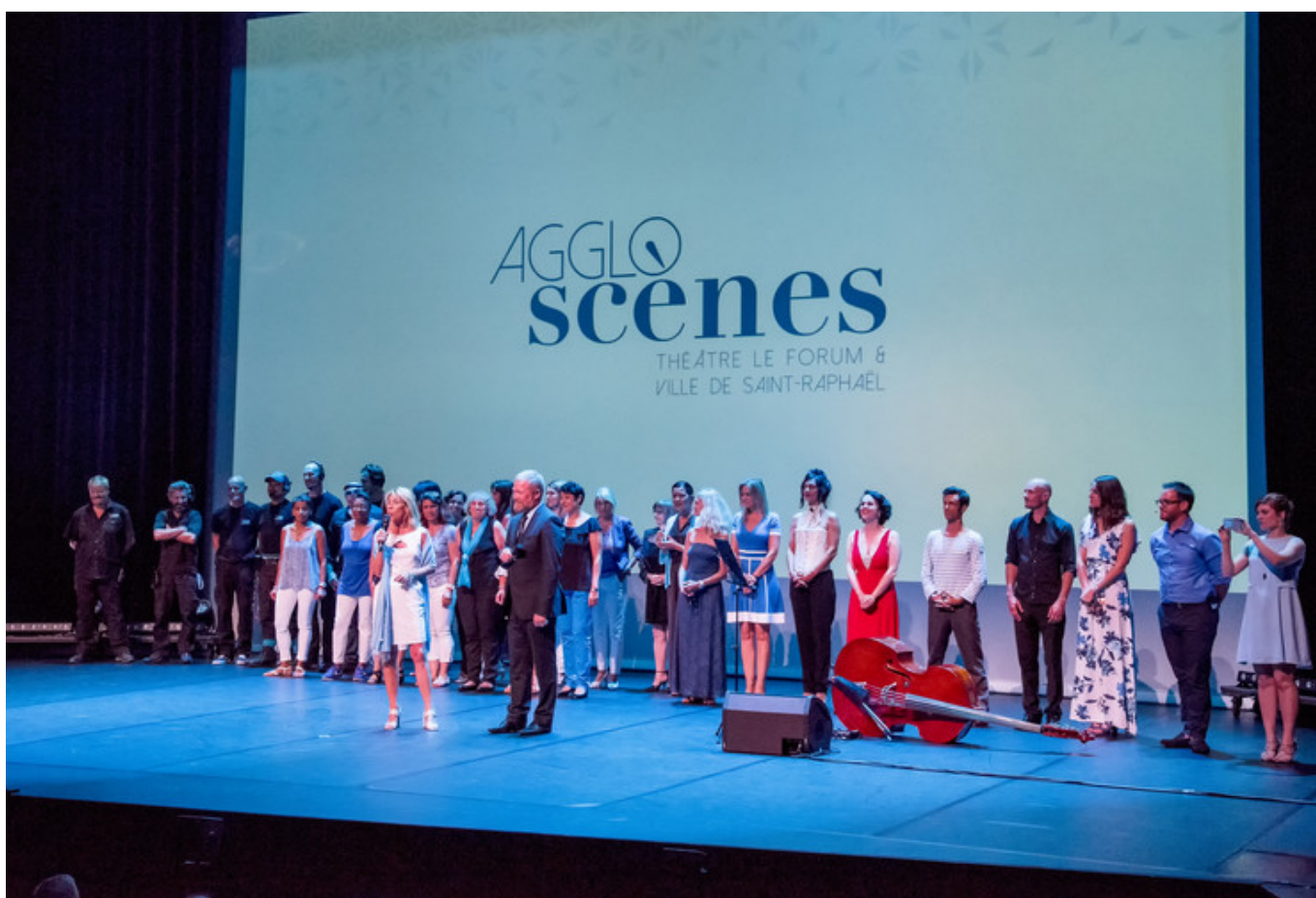
Présentation de la saison culturelle 2017-2018, le 20 juin au Théâtre Intercommunal le Forum

La saison culturelle Aggloscènes 2017-2018 a été présentée au public ce mardi 20 juin au Théâtre Intercommunal le Forum.