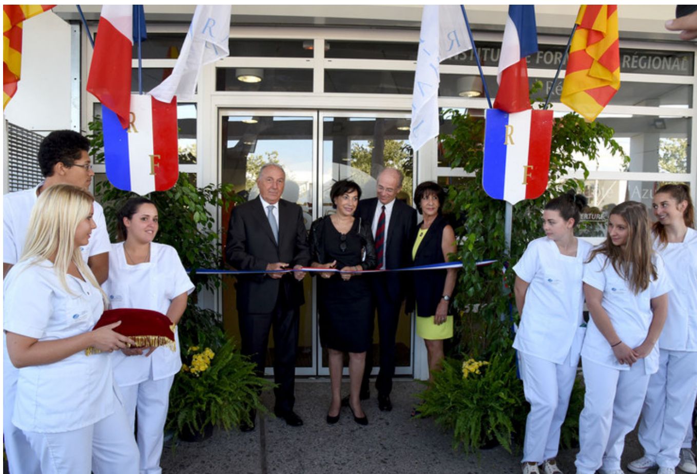
Inauguration du nouveau centre de formation IFPVPS, le 30 septembre 2016 à Saint-Raphaël.

Le nouveau centre de l'IFPVPS a ouvert ses portes aux étudiants à la rentrée dans les locaux de l'ancien IUT de Saint-Raphaël, 200 avenue Victor Sergent.